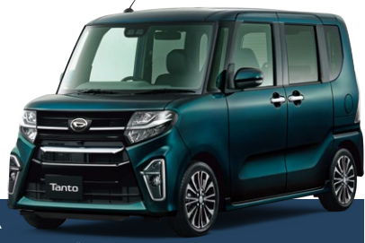
Photo:ボディカラーはレーザーブルークリスタルシャイン(27,500円(税込)のメーカーオプションカラー)記載の価格には含まれません。