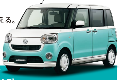
Photo:パールホワイト車×ファインミントメタリック(66,000円(税込)のメーカーオプションカラー)記載の価格には含まれません。