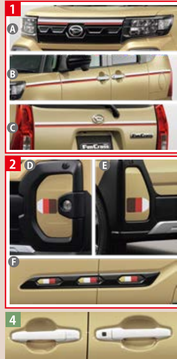
Photo: オプション装着イメージ。タントファンクロスターボ (ボディカラー: ブラックマイカメタリック×サンドベージュメタリックはメーカーオプションで、55,000円(消費税込)高)